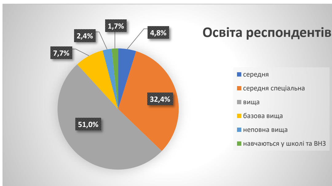
Малюнок 3. Розподіл респондентів за освітою