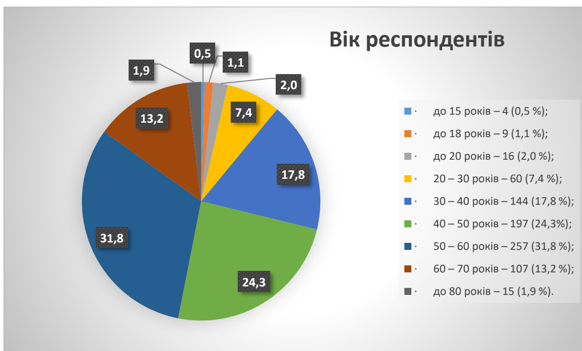
Малюнок 2. Розподіл респондентів за віком